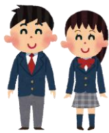
旭 LINE 同盟

大阪府立旭高等学校で結成された有志生徒のグループ。現役高校生ならではの視点で、LINE 利用の実際について、NHK や旭区役所、小学校 PTA の会などで講演。9 月 15 日には講演内容をまとめた『高校生が教える先生・保護者のための LINE 教室』（学事出版）を刊行。