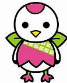
鶴見区マスコットキャラクター「つるりっぷ」