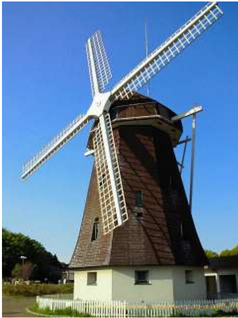
鶴見新山の風車の丘