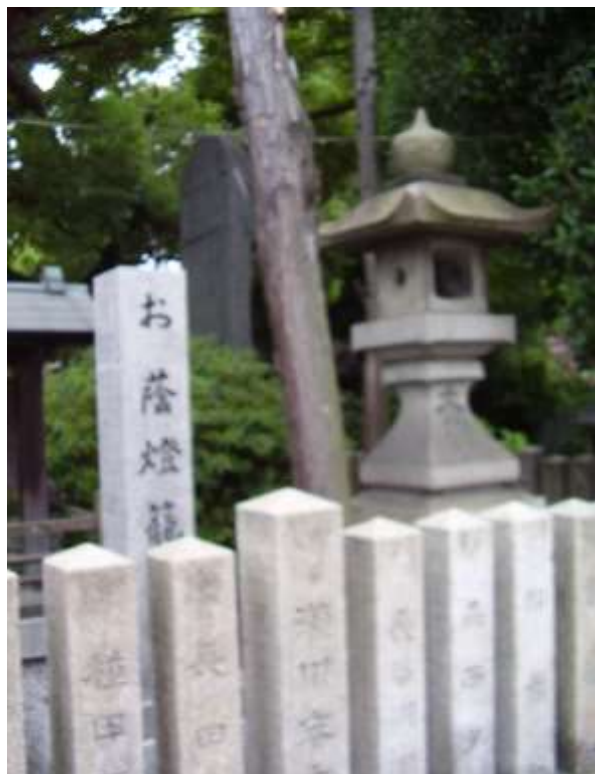
お蔭燈籠

WEB「おおさか資料室」→「大阪に関するよくある質問」→「鶴見区」『阿遅速雄(あぢはやお)神社のお蔭燈籠について』