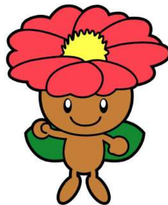
住之江区マスコットキャラクター「さざびー」