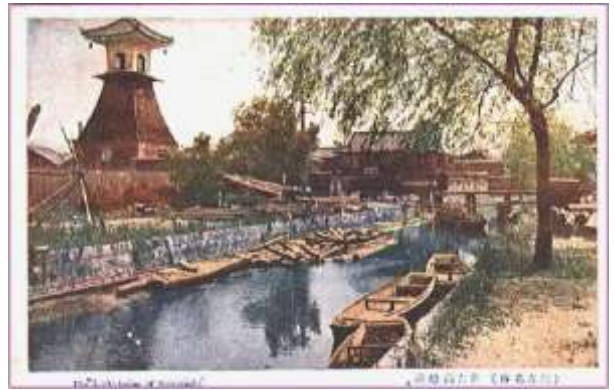
絵はがき『(住吉名勝) 住吉高燈籠』(刊年等不明)

WEB「調べる・相談する」→「おおさか資料室」→「大阪に関するよくある質問」→「住之江区」『住吉高燈籠(すみよし たかどうろう)について』