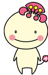
阿倍野区マスコット キャラクターあべのん