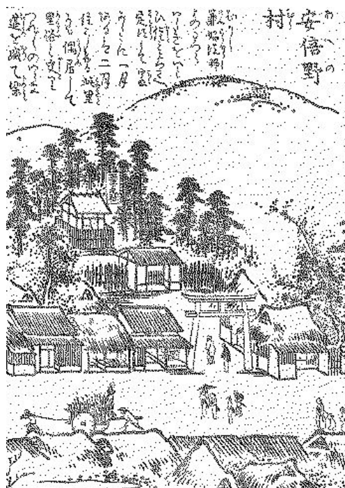
住吉名勝図会より安倍野村