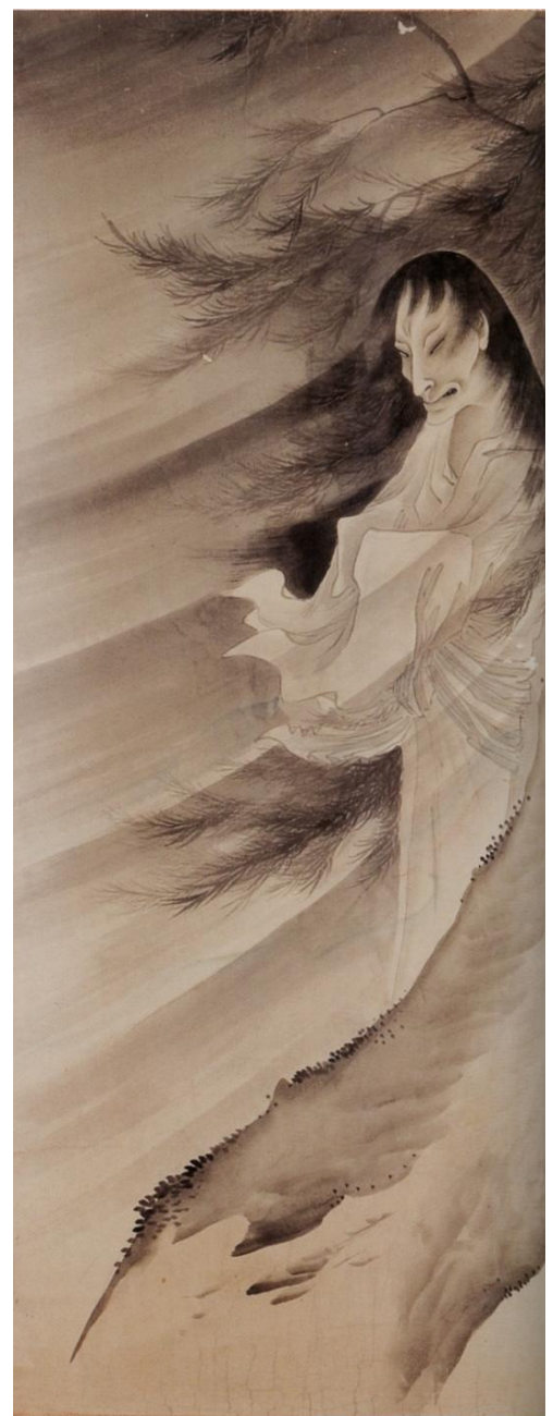
大念佛寺所蔵「柳下幽霊図」