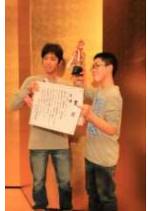
写真：第2回優勝コンビ 「サクリファイス」

【日時】平成26（2014）年11月23日（日・祝） 午後2時～4時（開場 午後1時30分）