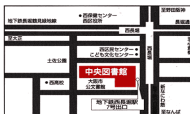
地下鉄千日前線・長堀鶴見緑地線西長堀駅7号出口すぐ

■お問い合わせ 大阪市立中央図書館 利用サービス担当 〒550-0014 大阪市西区北堀江4-3-2 でんわ 06-6539-3302