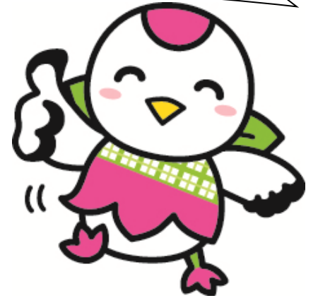
鶴見区マスコットキャラクター「つるりっぴ」