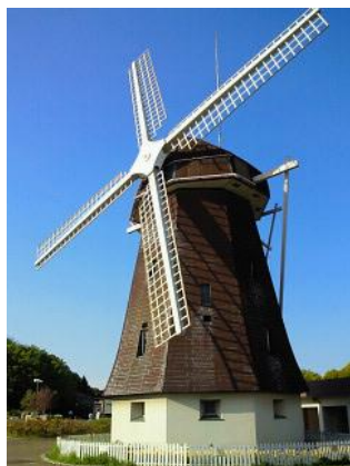
鶴見新山の風車の丘

つるみしんざん ひょうこう しな い もつと たか やま しみん た「鶴見新山」は、標高45メートルの市内で最も高い山です。