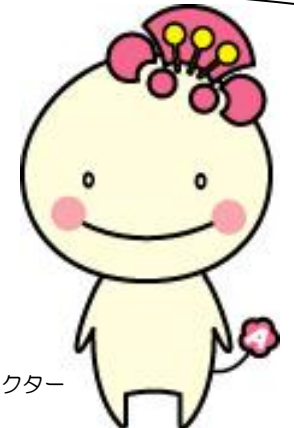
阿倍野区マスコットキャラクター「あべのん」

この調べかたガイドは、区ごとに2つのことがらを選び、それについて調べるのに役立つ図書館の本や、ホームページで見られる情報を、まとめたものです。