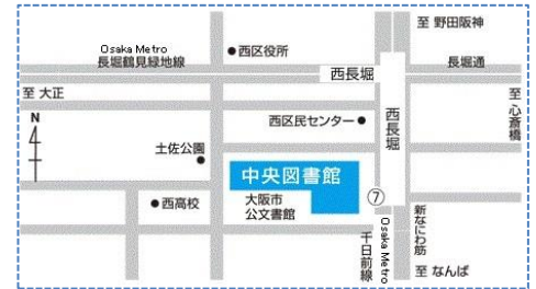
Osaka Metro 千日前線・長堀鶴見緑地線 西長堀駅下車 7号出口すぐ

〒550-0014 大阪市西区北堀江 4-3-2 大阪市立中央図書館 利用サービス担当 書評漫才グランプリ担当 電話 06-6539-3303 FAX06-6539-3336 https://www.oml.city.osaka.lg.jp/