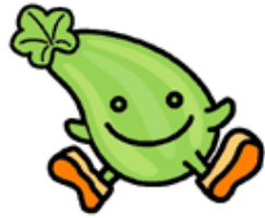
東成区マスコットキャラクター 「ういちゃん」