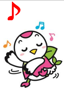
つるみく 鶴見区マスコットキャラクター