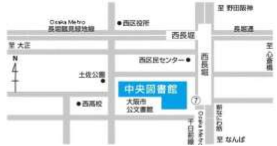
Osaka Metro 千日前線・長堀鶴見緑地線 西長堀駅下車 7号出口すぐ