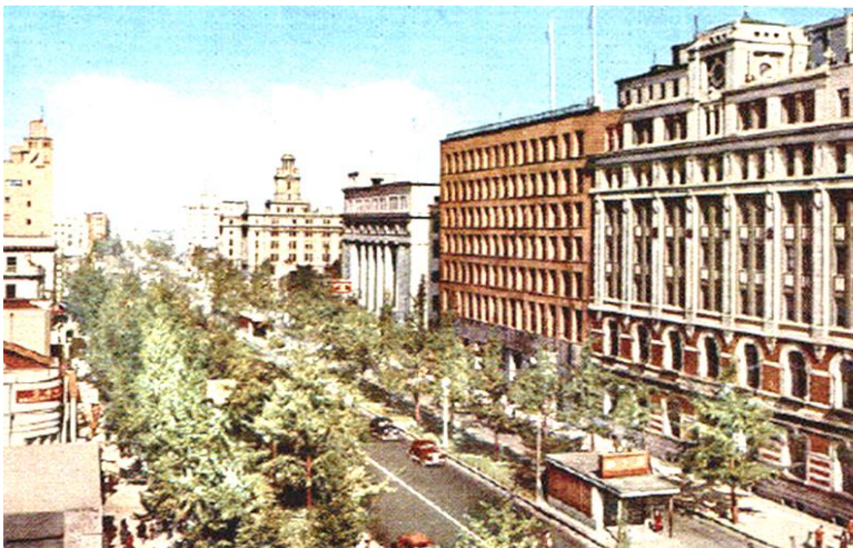
『大阪名所 御堂筋 [大阪・東京名所絵葉書]』 1921頃(大正-昭和初期頃)

御堂筋拡張工事や地下鉄建設なども進み、 大都市へと変貌したそのころの大阪市は、 「大大阪」と呼ばれました。