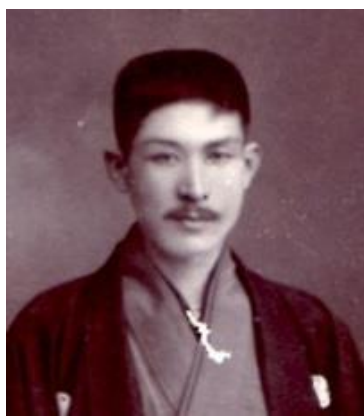
警視庁時代の池上四郎(福島中央テレビ番組「池上四郎～不世出の名市長～」より)