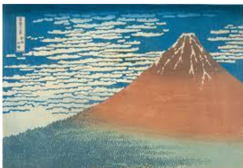
葛飾北斎「富嶽三十六景 (左) 神奈川沖浪裏 (右) 凱風快晴」