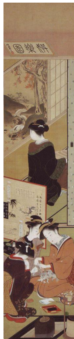
勝川春章「婦女風俗十二ヶ月図 十月 炉開」