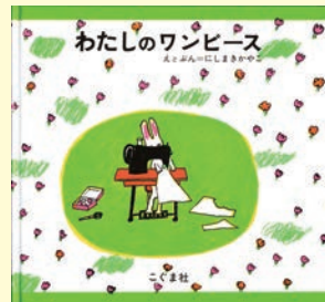
『わたしのワンピース』 えとぶん=にしきかやこ(こくま社)

ぬりえと絵本は、随時お楽しみください。好きなように描いて「わたしだけのワンピース」を作っちゃおう!色鉛筆・クレヨン等は図書館で用意します。小・中学生ボランティアグループ「キッズスマイルブック」による読み聞かせは、13:30頃~、13:45頃~、14:00頃~の3回おこなう予定です。