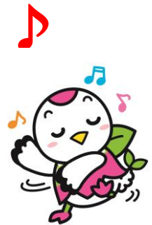
つるみく 鶴見区マスコットキャラクター