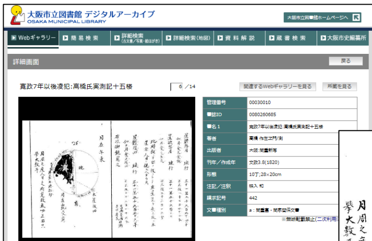
『寛政七年以後凌犯：高橋氏実測記十五楼』

★当館の「間重富・間家関係文書」は、 「大阪市立図書館デジタルアーカイブ http://image.oml.city.osaka.lg.jp/archive/ 」 上のデジタル画像でご覧いただけます。