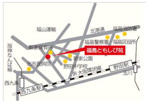
福島ともしび苑 大阪市福島区吉野5-6-11