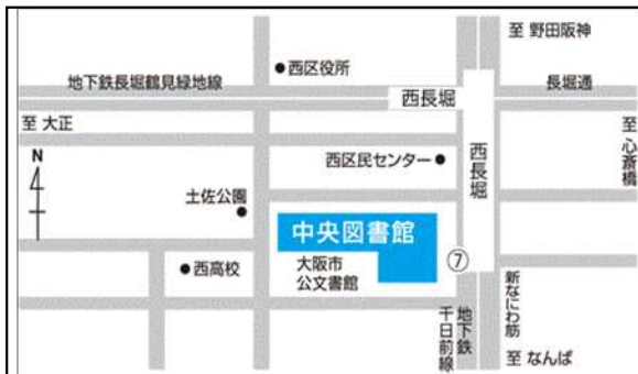
大阪市立中央図書館 大阪市西区北堀江4-3-2