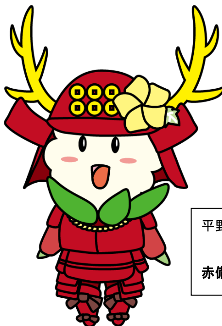
平野区のマスコットキャラクター ひらちゃん 赤備えの「幸村ひらちゃん」