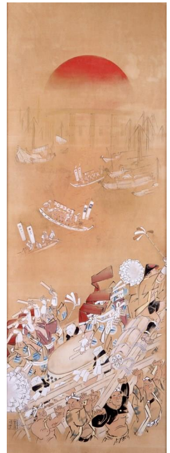
『赤日浪速人』菅楯彦・画 (大阪新美術館建設準備室蔵)

阿倍野を拠点にしながら大阪を代表する日本画家として活躍した菅楯彦(すが・たてひこ 1878-1963)の生涯と画業を紹介する講座です。有職故実の教養を生かした歴史画とともに、大阪の市井風俗を描いた彼の、区内・市内のゆかりの地についても紹介します。